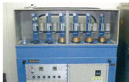
セメント自動凝結試験機