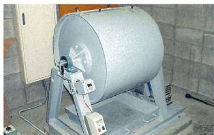
ロサンゼルス試験機 (骨材すりへり試験機)