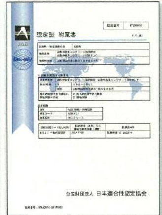
ISO認定登録証(附属書)