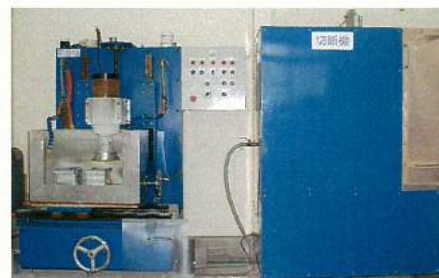
コア切断・研磨機