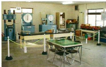
コンクリート試験室