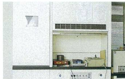
アル骨試験用ドラフトチャンバー